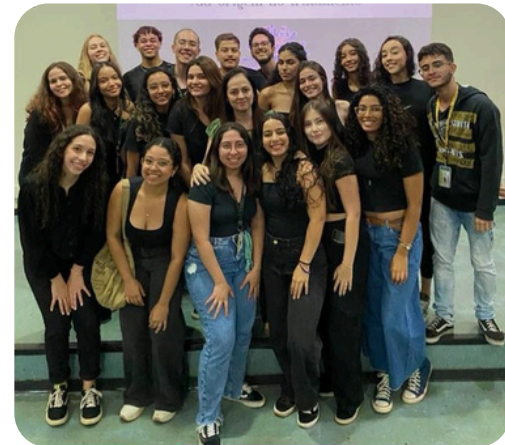
Graduandos de Biomedicina da Turma L da UFTM.